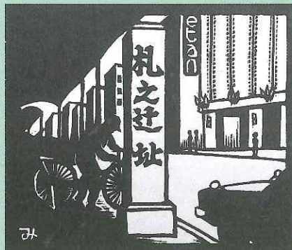
海野光弘版画『静岡三十五景』より「札の辻」