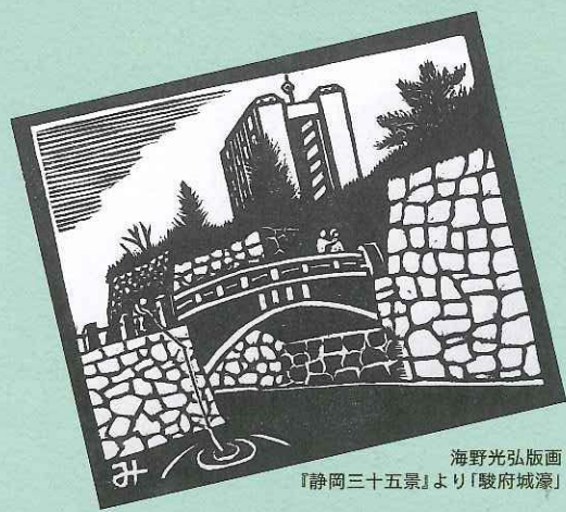
海野光弘版画『静岡三十五景』より「駿府城濠」