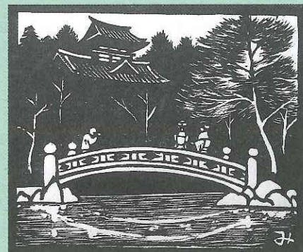
海野光弘版画『静岡三十五景』より「浅間神社」