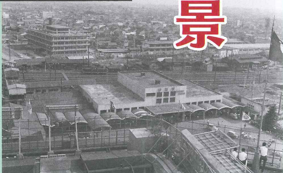
関教司 「松坂屋屋上からの静岡駅」 静岡市文化財資料館蔵