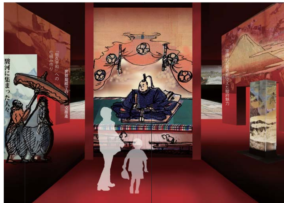
大御所様に謁見するため 駿府を訪れる西洋人 (グラフィックパネル)

大御所として駿府に戻られた家康公に謁見させていただく空間。家康画像の絵から3D立体モデリングで、家康像を立体で蘇らせる。