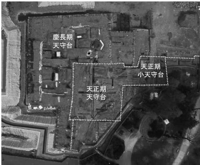
写真 1 天守台検出写真（真上から撮影）