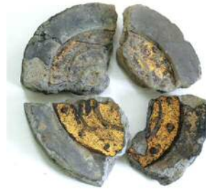
写真 2 金箔瓦（軒丸瓦・凹面金箔）