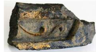
写真 3 金箔瓦（軒平瓦・凸面金箔）